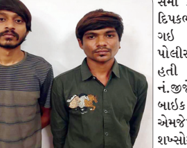
મુખ્ય સમાચાર, રાજકોટ