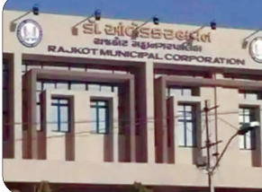
મુખ્ય સમાચાર, રાજકોટ

રાજકોટ જિલ્લામાં ૧૯.૪૨ લાખ મતદારો: ૧૧ તાલુકાઓમાં ૯.૫૬ લાખ વોટર્સ