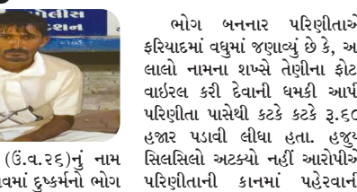
મુખ્ય સમાચાર, રાજકોટ

કોટો વાઈરલ કરી દેવાની ધમકી આપી રૂ.૬૦ હજાર અને સોનાની કાનસર પણ પડાવી લીધી