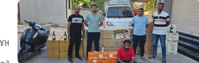
મુખ્ય સમાચાર, રાજકોટ

ખોટી નંબર પ્લેટ લગાડેલ ટ્રકમાં દાડુ ભર્યો હતો: એક પકડાયો, ત્રણ છૂ: ૩. ૧૫,૪૩,૪૦૦ નો મુદ્દામાલ જમ