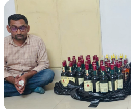
મુખ્ય સમાચાર, જેતપુર

રાજકોટ ગ્રામ્ય એલ. સી. બી. એ ભાતમીના આધારે વોચ ગોઠવી: ટાટા હેક્સા કારમાંથી ૧૧૫ બોટલ દાડુ કબજે કર્યો