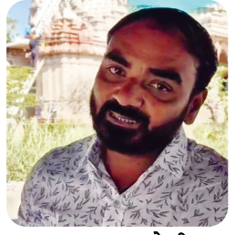
મુખ્ય સમાચાર, મોરબી