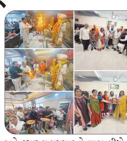
મુખ્ય સમાચાર, મોરબી મોરબીના જલારામ ધામ ખાતે રામનવમીના પાવન અવસરે શ્રી જલારામ સેવા મંડળ દ્વારા ત્રિવિધ ધાર્મિક કાર્યક્રમોનું આયોજન કરવામાં આવ્યું હતું. પ્રભુ શ્રીરામના પૂજન અને મહાઆરતી સાથે સંસ્થાના સેવાકાર્યમાં સહયોગ આપનાર આગેવાનોનું અભિવાદન કરવામાં આવ્યું હતું. કાર્યક્રમ દરમિયાન મોટી સંખ્યામાં ભક્તોએ હાજરી આપી

પૂજન-મહાઆરતી સાથે સહયોગીઓનું સન્માન, ભક્તજનો માટે મહાપ્રસાદનું આયોજન કરાયું