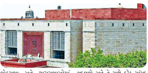
લોકસભા અને ધારાસભાઓમાં મહિલાઓને ૩૩ ટકા અનામતની સાથે આવશ્યકતા મુજબ રાજ્યોની ધારાસભા અને લોકસભામાં બેઠકો વધારવાની પણ જોગવાઈ છે જેમાં ખાસ કરીને આગામી વર્ષે જે વસતિ ગણતરી શરૂ થવાર છે તેના આધારે લોકસભાની બેઠકોના સીમાંકન પણ

મુખ્ય સમાચાર, નવીદિલ્હી દેશમાં મહિલાઓ માટે ધારાસભા અને સંસદમાં ૩૩ ટકા અનામતનો અમલ ૨૦૨૬થી શરૂ થવાનો છે અને તેની સાથે ૨૦૨૭ના પ્રારંભે નવી વસતિ ગણતરી પણ થશે અને તે બાદ લોકસભાની બેઠકોના સીમાંકન પણ બદલાશે અને સૌથી મહત્વનું દેશમાં લોકસભાની હાલ ૫૪૩ બેઠકો છે. તેના સ્થાને મહિલા અનામત સહિતની કુલ ૮૧૬ બેઠકો હશે તે નિશ્ચિત કરવામાં આવી રહ્યું છે. કેન્દ્ર સરકાર દ્વારા મહિલાઓને આરક્ષણ આપવા માટે અને લોકસભામાં સંતુલન જળવાઈ રહે તે માટે એક ખાસ બંધારણ સુધારો ખરડો સંસદમાં રજૂ કરાશે અને તેમાં