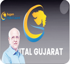
પ્લેટફોર્મ હેઠળ દર વર્ષે અંદાજે ૧.૨૦ કરોડ અરજીઓ પ્રાપ્ત થાય છે, જેમાંથી આશરે ૮૦ લાખ અરજીઓ આ ૨૦ ઉચ્ચ-ટ્રાન્ઝેક્શન સેવાઓ હેઠળ પ્રાપ્ત થાય છે, જે આ સેવાઓના નાગરિક જીવનમાં રહેલા મહત્વને દર્શાવે છે. આ જ દિશામાં આગળ વધતાં, વિજ્ઞાન અને ટેકોલોજી વિભાગ દ્વારા સુગમ ડિજિટલ ગુજરાત પહેલ અમલમાં મૂકવામાં આવી રહી છે. આ પહેલનો મુખ્ય ઉદ્દેશ ફેસલેસ, ડેટાલેસ અને પેપરલેસ વહીવટને પ્રોત્સાહન આપી સરકારી સેવાઓને વધુ સરળ, ઝડપી અને પારદર્શક બનાવવાનો છે, જેથી નાગરિકોને સેવાઓ સરળતાથી અને આગળનાં ટેરવે ઉપલબ્ધ બની શકે. રાજ્ય સરકારની સેવાઓમાં નાગરિક કેન્દ્રી વહીવટ કેન્દ્રમાં રહ્યો છે. આ અભિયાનનાં પ્રથમ તબક્કે સૌથી વધુ અરજીઓ ધરાવતી ૨૦ સેવાઓને આવી લેવામાં આવી છે. જે ૨૦ સેવાઓ ઓનલાઈન કરવામાં આવી છે તેમાં સામાજિક ન્યાય અને અધિકારીતા વિભાગ, મહેસૂલ વિભાગ, કાયદા વિભાગ અને આઈજીટી વિકાસ વિભાગનો સમાવેશ થાય છે. આ સેવાઓ નાગરિકો રાજ્ય સરકારનાં ડિજિટલ ગુજરાત પોર્ટલ પરથી મેળવી શકશે.

કેલેરા એનર્જીમાં આગ ભભૂકી કેલેરા એનર્જીમાં આગ ભભૂકી કેલેરા એનર્જીમાં આગ ભભૂકી