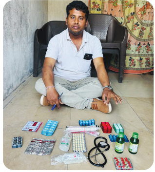
મુખ્ય સમાચાર, જામનગર

જામનગરના ગ્રામ્ય વિસ્તારોમાં ગરીબ દર્દીઓના આરોગ્ય સાથે કેટલાક બોગસ તબીબો ચેડા કરી રહ્યા છે, તેવી માહિતીના આધારે એસ.ઓ.જી.શાખાની ટુકડીએ જામનગર તાલુકાના દરેડ, સચાણા ઉપરાંત મેઘપર પંચકમાં દરોડાઓ પાડ્યા હતા, અને એકી સાથે ચાર બોગસ તબીબોને ઝડપી લીધા છે, અને તેઓ