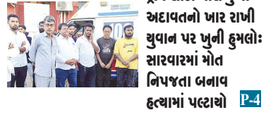
ક્રીમ સીટી પાસે ખુબી અદાવતનો ખાર રાખી યુવાન પર ખુબી દુખાવો: સારવારમાં મોત નિપજતા બનાવ હત્યામાં પલ્ટાયો P-4

Year-16, Issue-282 ■ DATE : 16-03-2026 MONDAY ■ Retail Selling Price : Rs. 3/- ■ Page-4 ■ DAILY EVENING (MONDAY TO SATURDAY) Language : GUJARATI