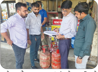
અવેલા 'કૈલાશ ફરસાણ'માં ઘરેલુ સિલિન્ડરનો કોમર્શિયલ હેતુ માટે ઉપયોગ થતો હોવાથી ઈન્ડેન કંપનીના ત્રણ ગેસ સિલિન્ડર તેમજ