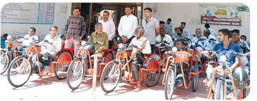
મુખ્ય સમાચાર, જામનગર

જામનગર જિલ્લા સમાજ સુરક્ષા અધિકારીની કચેરી દ્વારા દિવ્યાંગ વ્યક્તિઓના જીવનમાં સ્વાલંબન અને ગતિશીલતા લાવવાના ઉદ્દેશ્યે આશય સાથે સરકારી ચિલ્ડ્રન હોમ ફોર બોયઝ ખાતે એક વિશેષ કાર્યક્રમનું આયોજન કરવામાં આવ્યું હતું. આ કાર્યક્રમમાં કુલ ૩૦ દિવ્યાંગ લાભાર્થીઓને મોટરસાઈકલ ટ્રાયસાઈકલ મોટરસાઈલિટ ટ્રિ-ચક્રીય વાહનનું વિતરણ કરવામાં આવ્યું હતું. ગુજરાત સરકારની દિવ્યાંગ કલ્યાણ યોજનાનો હેડગ્રેડ ૬૦% કે તેથી વધુ હલનચલનની દિવ્યાંગતા ધરાવતી વ્યક્તિઓને આ અત્યાધુનિક સાધન સહાય વિનામૂલ્યે પૂરી પાડવામાં આવી છે. આ મોટરસાઈકલ ટ્રાયસાઈકલ મળવાથી દિવ્યાંગ