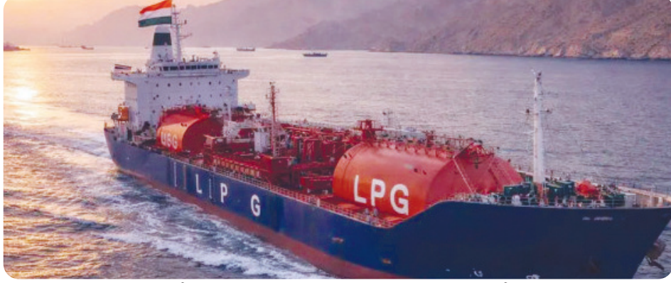
અહીં ફસાયેલું તેને ભારતીય નૌકાદળે હટાડીને આ જળમાર્ગ પસાર કરાવ્યો હતો અને હવે તે મુંબઈ અથવા કંડલા પોર્ટ પર સુરતને તૈનાત કર્યું છે અને તે ભારતીય જહાજોને યુદ્ધ વચ્ચે સુરક્ષા આપવાનું કામ કરે છે.

મુખ્ય સમાચાર, નવીદિલ્હી ખાલી રહેલા યુદ્ધ અને ખાસ કરીને હોર્મુઝ જળમાર્ગ ઈરાને બંધ કરતા ભારત માટે કુદતેલ અને ગેસના ટેન્કરો આ ક્ષેત્રમાંથી પસાર કરાવવાનું મુશ્કેલ બની ગયું છે. તે વચ્ચે લાંબા સમયથી દરિયામાં ફસાયેલા ભારતીય એલપીજી ટેન્કર શિવાલીક એ ભારતીય નૌસેનાના પાયલોટીંગ વચ્ચે હોર્મુઝનો જળમાર્ગ સલામત પાર કરીને હવે ભારત ભણી રવાના થયું છે.