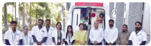
મુખ્ય સમાચાર, જામનગર

જામનગર જિલ્લાના ગ્રામ્ય વિસ્તારોમાં આરોગ્ય સેવાઓને વધુ સશક્ત બનાવવા માટે રાજ્ય સરકાર દ્વારા શરૂ કરાયેલ ધન્યવંતરી આરોગ્ય રથ યોજના અંતર્ગત ધન્યવંતરી આરોગ્ય રથને આજે જિલ્લા કલેક્ટર કેતન ઠક્કર દ્વારા કલેક્ટર કચેરી ખાતેથી લીલી ઝંડી આપી પ્રસ્થાન કરાવવામાં આવ્યું હતું. આ પ્રસંગે જિલ્લા કલેક્ટરે ગુજરાત મકાન અને અન્ય બાંધકામ શ્રમયોગી કલ્યાણ બોર્ડ તથા મેડીકલ સ્ટાફ પાસેથી દવાઓનો સ્ટોક, વાહનનો રૂટ વગેરે અંગે માહિતી