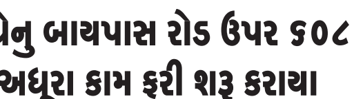
મુખ્ય સમાચાર, મોરબી

મોરબી મહાનગરપાલિકા દ્વારા કામધેનુ બાચપાસ રોડ પાસે આવેલ IHSDP યોજના હેઠળ નિર્મિત ૬૦૮ આવાસોના અધૂરા કામ પૂર્ણ કરવા માટે કામગીરી ફરી શરૂ કરવામાં આવી છે. ટેન્ડર પ્રક્રિયા પૂર્ણ કરીને નવી એજન્સીની નિમણૂક કરાતા બાકી રહેલા કામ ઝડપથી પૂર્ણ કરવાની પ્રક્રિયા હાથ ધરાઈ છે. મોરબી મહાનગરપાલિકા દ્વારા કામધેનુ બાચપાસ રોડ પાસે દલવાડી સર્કલ નજીક વજેપર વિસ્તારમાં સર્વે નં. ૧૪૧૫/૩ ની જમીન પર મુખ્યમંત્રી આવાસ યોજના હેઠળ ૬૦૮ આવાસોનું નિર્માણ કરવામાં આવ્યું હતું. આ પ્રોજેક્ટ માટે તા. ૨૨ માર્ચ ૨૦૨૧ના રોજ કોમ્પ્યુટરાઈઝડ પ્રો દ્વારા ૬૦૮ લાભાર્થીઓની પસંદગી કરવામાં આવી હતી. પ્રોજેક્ટનું મુખ્ય બાંધકામ વર્ષ ૨૦૨૧માં પૂર્ણ થઈ ગયું હતું, પરંતુ બારી-બારણાં કિટિંગ, કંબર કામ, ઈલેક્ટ્રિક કામ, ડ્રેનેજ કનેક્શન, વલ્મિંગ, કંપાઉન્ડ વોલ, મેઈન ગેટ, ગાર્ડન, સ્ટ્રીટ લાઈટ સહિતની કેટલીક કામગીરી બાકી રહી હતી.