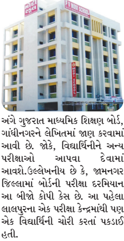
મુખ્ય સમાચાર, જામનગર

જામનગર જિલ્લામાં ધોરણ ૧૦ અને ૧૨ની બોર્ડની પરીક્ષાઓ ચાલી રહી છે. આ દરમિયાન આજે ધોરણ ૧૦ના પેપરમાં વધુ એક વિદ્યાર્થીની કોપી કરતાં ઝડપાઈ છે. આ ચાલુ પરીક્ષાનો બીજો કોપી કેસ નોંધાયો છે. આ ઘટના જામનગરની પી.વી. મોદી હાઈસ્કૂલના પરીક્ષા કેન્દ્રના બ્લોક નંબર ૧૭૭માં બની હતી. ધોરણ ૧૦ની ગુજરાતી (દ્વિતીય ભાષા) કોડ નંબર ૧૩ની પરીક્ષા ચાલી રહી હતી. કોપી કરનાર વિદ્યાર્થીની પોતાના રૂમાલમાં કાપેલી સંતાડીને પરીક્ષા આપી રહી હતી. પરીક્ષા ખંડના સુપરવાઈઝર દ્વારા આ વિદ્યાર્થીનીને કાપેલી સાથે ઝડપી પાડવામાં આવી હતી. તેની સામે કોપી કેસ નોંધવામાં આવ્યો છે. આ