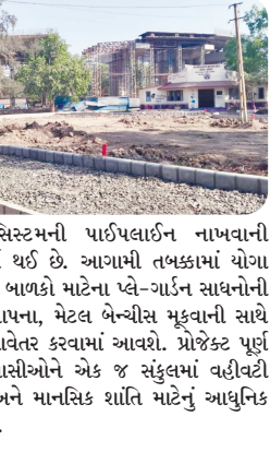
મુખ્ય સમાચાર, મોરબી

મોરબી મહાનગરપાલિકાના ડ્રીમ પ્રોજેક્ટ "કેસરબાગ" સ્માર્ટ પાર્કનું કામ હાલ પુરોજશમાં ચાલી રહ્યું છે. અત્યાર સુધીમાં આશરે ૨૫ ટકા કામગીરી પૂર્ણ થઈ ગઈ છે. પ્રોજેક્ટ પૂર્ણ થયા બાદ મોરબીવાસીઓને વહીવટી સુવિધા સાથે આરામ અને સ્વાસ્થ્ય માટે આધુનિક બગીચો મળશે. મોરબી શહેરના વિકાસને નવી દિશા આપતા મોરબી મહાનગરપાલિકાના "કેસરબાગ" સ્માર્ટ પાર્ક પ્રોજેક્ટની કામગીરી યુદ્ધના ધોરણે આગળ વધી રહી છે. મહાનગરપાલિકા દ્વારા અહીં વોર્ડ ઓફિસ સાથે નાગરિકો માટે આધુનિક સુવિધાઓ ધરાવતો બગીચો તૈયાર કરવામાં આવી રહ્યો છે. પ્રોજેક્ટ અંતર્ગત કમ્પાઉન્ડ વોલ અને સુરક્ષા કેબિનનું પાયાનું કામ તેમજ સ્ટ્રક્ચરલ ફેમવર્ક પૂર્ણતાની નજીક છે. ઉપરાંત સ્ટોન વોક-વે અને ડ્રેનેજ સિસ્ટમ માટે ગ્રાઉન્ડ લેવેલિંગ તથા માર્કિંગ પૂર્ણ કરવામાં આવ્યું છે. હરિયાળી વધારવા માટે ડ્રિપ ઈરિગેશન