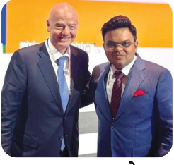
મુખ્ય સમાચાર, રાજકોટ

આંતરરાષ્ટ્રીય ક્રિકેટ કાઉન્સિલ દ્વારા યોજવામાં આવેલા મેન્સ T20 વર્લ્ડ કપ ૨૦૨૬માં યજમાન દેશ ભારતે અમદાવાદના ખીચોખીચ ભરેલા નરેન્દ્ર મોદી સ્ટેડિયમમાં રવિવારે રમાયેલી મેચમાં ન્યૂઝીલેન્ડની ટીમને હરાવીને ઐતિહાસિક ત્રીજું અને સતત ષીજું T20 વર્લ્ડ કપ ટાઇટલ જીત્યું હતું. T20 વર્લ્ડ કપ ૨૦૨૬ના આયોજનની સફળતા બાદ વૈશ્વિક રમત જગત આંતરરાષ્ટ્રીય