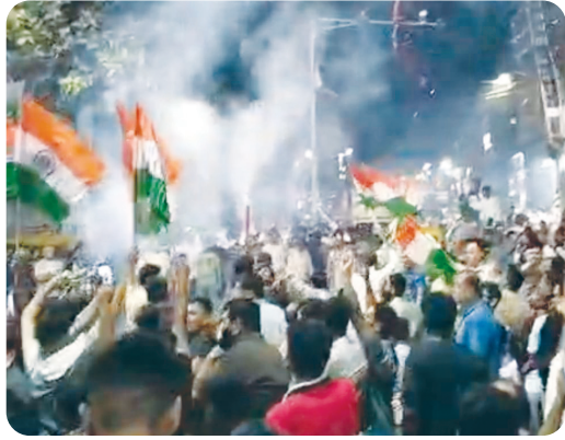
મુખ્ય સમાચાર, જામનગર જામનગર શહેરના અનેક વિસ્તારોમાં ભવ્ય આતશબાજીથી

ફાઈનલ મેચમાં ગઈકાલે રાત્રે ભારતે શાનદાર જીત મેળવી લઈ વર્લ્ડ કપ સતત બીજી વખત અને કુલ ત્રીજી વખત પોતાના નામે કરી લીધો હતો, જેના જીતનો ભવ્ય જશ્ન જામનગર શહેરમાં ગઈકાલે રાત્રે જોવા મળ્યો હતો, અને શહેરમાં ટેર ટેર આતશબાજી થઈ હતી, અને જાણે કે દિવાળી જેવો માહોલ સર્જાયો હતો. શહેરના અનેક વિસ્તારોમાં યુવા ક્રિકેટ પ્રેમીઓ પોતાના હાથમાં તિરંગા લઈને નીકળી પડ્યા હતા, અને ઢોલ નગારા સાથે શાનદાર જીતની ઉજવણી કરી હતી. તેમજ કેટલાક યુવાનો પોતાના હાથમાં તિરંગા ઝંડા લઈને બાઈક પર ભારત માતાકી જય ના નારા સાથે પણ શહેરમાં ઘુમી ભળ્યા હતા, અને ભારે ક્રિકેટ કીવર સર્જાયો હતો. જામનગર