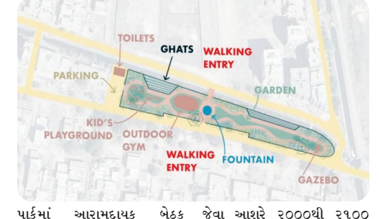
મુખ્ય સમાચાર, મોરબી

હરિયાળી જાળવવા ૨૦૦૦થી વધુ વૃક્ષોનું વાવેતર, જોગિંગ ટ્રેકથી લઈ સોલાર લાઈટ સુધીની સુવિધાઓ ઉપલબ્ધ થશે