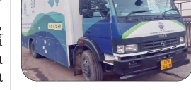
મુખ્ય સમાચાર, જામનગર ગુજરાત પ્રદૂષણ નિયંત્રણ બોર્ડ દ્વારા પર્યાવરણ સંરક્ષણ અને હવાની ગુણવત્તાની અસરકારક દેખરેખ માટે ૨ આધુનિક એન્વાયરમેન્ટલ મોનિટરિંગ મોબાઇલ વ્હીકલ EMVMVની ખરીદી કરવામાં આવી છે. જેમાંથી એક વાહન જામનગર અને સ્થિત પ્રદૂષણ નિયંત્રણ બોર્ડની કચેરીને ફાળવામાં આવ્યું છે. પ્રાથમિક ધોરણે આ મોબાઇલ મોનિટરિંગ વાહન દ્વારા જામનગર તેમજ દેવભૂમિ દ્વારા જિલ્લામાં

“એન્વાયરમેન્ટલ મોનિટરિંગ મોબાઇલ વ્હીકલ ફાળવાયું”