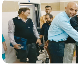
મુખ્ય સમાચાર, જામનગર જામનગર જિલ્લામાં આરોગ્ય સેવાઓને વધુ સશક્ત બનાવવા માટે જાંબુડા સામુહિક આરોગ્ય કેન્દ્રને આધુનિક “ટુનેટ TB મશીન”નું દાન આપવામાં આવ્યું છે. આ મશીન

ઉપસ્થિતિમાં મશીનનું હસ્તાંતરણ કરવામાં આવ્યું હતું. ટુનેટ TB મશીન દ્વારા નમૂનાઓનું ઝડપી પરીક્ષણ કરી સમયસર સારવાર શરૂ કરી શકાશે. જેના કારણે પ્રાચ્ય વિસ્તારમાં TB નિયંત્રણ અભિયાનને વધુ વેગ મળશે. સામાજિક જવાબદારી સમજી આરોગ્ય ક્ષેત્રે સહયોગ આપવાનો હેતુ રાખી સેવાનું ઉત્તમ ઉદાહરણ પૂરું પાડ્યું છે. જેના થકી પ્રાચ્ય વિસ્તારના લોકોને ફાયદો થશે. જિલ્લા આરોગ્ય તંત્રએ લોકલિટકારી પ્રયાસ બદલ આભાર વ્યક્ત કર્યો હતો. આ પ્રસંગે, આરોગ્ય કેન્દ્રના મેડિકલ ઓફિસરનો વગેરે ઉપસ્થિત રહ્યા હતાં.