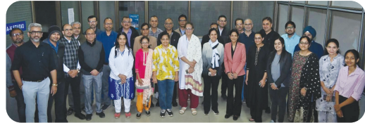
મુખ્ય સમાચાર, જામનગર તબીબી ક્ષેત્રે સંશોધન કાર્યને વધુ સચોટ, ગુણવત્તાયુક્ત અને અસરકારક બનાવવાના ઉમદા હેતુ સાથે જામનગરની એમ. પી. શાહ સરકારી મેડિકલ કોલેજ દ્વારા મેડિકલ રિસર્ચ ડેવલપમેન્ટ પ્રોગ્રામ અંતર્ગત રિસર્ચ મેથોડોલોજીના બેઝિક કોર્સની ચાર બેચનું સફળતાપૂર્વક આયોજન કરવામાં આવ્યું હતું. રાજ્યના આરોગ્ય અને પરિવાર કલ્યાણ વિભાગ તેમજ સ્ટેટ હેલ્થ સિસ્ટમ્સ રિસોર્સ સેન્ટરના માર્ગદર્શન હેઠળ યોજાયેલા આ કાર્યક્રમમાં કુલ ૧૩૦ જેટલા તબીબી શિક્ષકોએ

૧૩૦ તબીબી શિક્ષકોને સંશોધન કાર્યમાં ગુણવત્તા લાવવા માટે અપાઈ વિશેષ તાલીમ