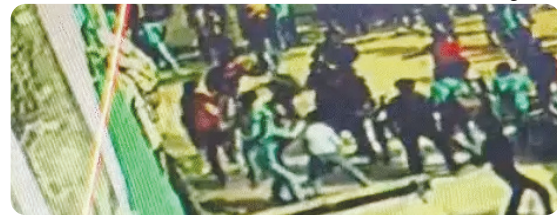
પૂજાણ કરતા માહિતી મળી છે. પ્રાથમિક માહિતીમાં સંચાલક દ્વારા જે રીતે જણાવવામાં આવેલું છે તે પ્રમાણે વિદ્યાર્થી જે છે શાળાની જે ઈન્જાઈનર છે તેને જીંદગી હોમીયોપેથમાં અને સારવાર આપી અને એને રજા પણ આપવામાં આવી છે.