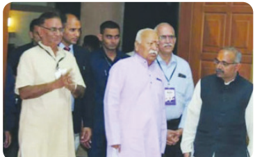
ભવન ખાતે આવી પહોંચ્યા છે. રાજકોટમાં ડો. મોહનજી ભાગવતના આજીવન બે દિવસના ભરતક કાર્યક્રમો છે. આ પ્રવાસ દરમ્યાન કોઈ જાહેર કાર્યક્રમનું આયોજન નથી.

સળતી માહિતી અનુસાર આજે સવારે પ્રમોવોજીનું કાર્યક્રમ તથા સાંજે પ્રતિભાષણી યુવાનો સાથેના કાર્યક્રમનું આયોજન કરાયું છે. આવતીકાલે કલાકારો સાથે સંવારના ભાવને ગોષ્ઠિ કરશે તથા સાંજે વ્યક્તિગત રીતે મહાનુભાવોને મળશે.ભાગવત કથાકાર પુસ્તકોમાં ઓડિયો સાથે મુલાકાત થનાર છે. આજે સવારે કાર્યક્રમોનો તથા આર.એમ.એસ.ના આજીવન સાથે પણ બેઠક યોજનાર છે. રાષ્ટ્રીય સ્વયંસેવક સંઘ શાખાની વર્ષની અંતિમ ભારતીય પ્રવાસ યોજના અંતર્ગત વ. પૂ. સરસંઘકથાકાર ડો. મોહનજી ભાગવતનું આજે સોરઠર પ્રાંતની મુલાકાત અર્થે રાજકોટ સેવાભારતી ભવન ખાતે આગમન થયું છે.