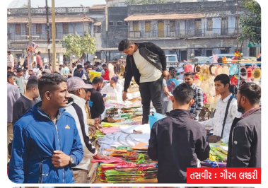
તસ્વીર : મોવ્ય લક્ષ્મી