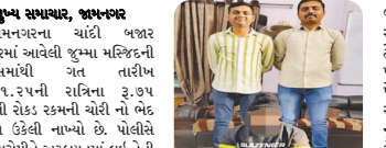
મુખ્ય સમાચાર, જામનગર

જામનગરના ચાંદી બજાર વિસ્તારમાં આવેલી જુમ્મા મસ્જીદની ઓફિસમાંથી ગત તારીખ ૧૬.૧૧.૨૫ની રાત્રિના ૩.૩૭ હજારની રોકડ રકમની ચોરી નોંધે પોલીસે ઉકેલી નાખ્યો છે. પોલીસે એક આરોપીને અટકાવવામાં લઈ તેની પાસેથી રૂ.૭૫ હજારની રોકડ રકમ જપ્ત કરી છે.