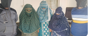
મુખ્ય સમાચાર, જામનગર

જામનગર શહેરમાંથી ત્રણ મહિલા સહિતના ૫૫ બાંગ્લાદેશી નાગરિકો મળી આવ્યાં પોલીસ તંબુમાં દોડામણ થઈ છે. જામનગર પોલીસ દ્વારા શહેરના ૨૬ કોલોની વિસ્તારમાં પેટ્રોલિંગ હાથ ધર્યું હતું. આ દરમિયાન જામનગરમાં પેટલ કોલોની, ચેરી નંબર-૧૧, સ્વસ્તિક માર્ગવાસની સામે આવેલા ગુલામપુલિન અનુકરમીયાના ગાદલાહીના મકાનમાં બાંગ્લાદેશી નાગરિકો ગેરકાયદેસર રીતે વસવાટ કરતા હોવાની એસ.ઓ.એ. સ્ટાફને ખાતરી મળી હતી.