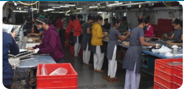
મુખ્ય સમાચાર, મોરબી

મોરબી વિકાસના માર્ગે ગુજરાતે હંમેશા કાળ ભરીને દેશના અન્ય રાજ્ય માટે વિકાસ મોડલ બન્યું છે. ઓદ્યોગિક ક્ષેત્રે ગુજરાતે અનન્ય પ્રગતિ સાધે છે. ગુજરાતને આગ્રહીય ગણવામાં આવેલા વિકાસના માર્ગે પ્રેરકભાવ બનવાનું કામ કર્યું છે. ત્યારે ગુજરાતના માર્ગે ગુજરાતે હંમેશા ગુજરાતને વિચારતરે નામાઈત કર્યું છે. સિરામિક અને ઘડિયાળ ઉદ્યોગ ક્ષેત્રે સાથેલા અનન્ય વિકાસ થઈ વિકાસનું મોડલ બન્યું છે મોરબી. અહીંના ઉદ્યોગોના વિકાસ માટે સરકાર દ્વારા ગત ૨ વર્ષમાં ૧૨૦૦ થી વધુ ઓદ્યોગિક એમ.ઓ.યુ. રૂ.૪૬૦ કરોડથી વધુની માણાકીય સહાય પૂરી પાડી છે. ગુજરાત વાયબ્રન્ટ સમિતિ અને આ વર્ષ સરકારે લીધેલા રિજિયોનલ વાયબ્રન્ટ કોન્સરના માધ્યમથી ઓદ્યોગિક