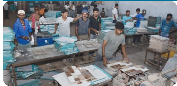
મુખ્ય સમાચાર, મોરબી

મોરબીમાં યોજાયેલ વાયબ્રન્ટ ગુજરાત અંતર્ગતના કાર્યક્રમમાં ૫૦ કંપનીઓ વચ્ચે રૂ.૨૪૭૦ કરોડનાં એમ.ઓ.યુ. થયા