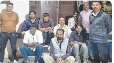
મુખ્ય સમાચાર, મોરબી