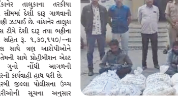
મુખ્ય સમાચાર, મોરબી

વાકાનેર તાલુકાના તરકીયા ગામની સીમાં દેશી દારૂ ગણવાની ચાલુ ભટ્ટી ઝડપાઈ છે. વાકાનેર તાલુકા સર્વેલન્સ ટીમે દેશી દારૂ તથા ભટ્ટીના સાધનો સહિત રૂ. ૧,૩૦,૧૫૦/-ના મુશ્કાલ સાથે ત્રણ આરોપીઓને ઝાપી તેમની સામે પ્રોટોકોલિન એક્ટ મુજબ ગુનો નોંધી આગળની કાર્યવાહી હાથ ધરી છે.