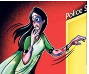
માનસિક ત્રાસ આપવા લાગ્યા હતા. પરંતુ તેણે પતિ પર સંસાર ચલાવવા હવે જેથી તે આ મૂળા મોઢે મહાન કરતી હતી. સાસરીયાઓને અવારનવાર દેહેજ આવતે પરિણીતાને હેરાન