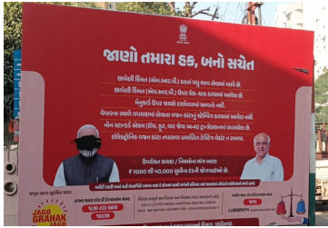
જાઓ તમારા ફક્ત બનો સચેત

રાજકોટ, તા. ૧૭ રાજકોટમાં વાઈબ્રન્ટ સમિટ પૂર્વે અસામાજિક તત્વોનું કૃત્ય; રાજકોટ: રાજકોટમાં આગામી ૧૦થી ૧૨ જાન્યુઆરી દરમિયાન યોજનાર સૌરાષ્ટ્ર-કચ્છ રિજનલ વાઈબ્રન્ટ સમિટમાં વડાપ્રધાન નરેન્દ્ર મોદી ધરાવવાના છે. તે પૂર્વે મોદીની હાઈડ્રોફલ વોક પાસે જાઓ આહત્ત જાઓના પોસ્ટરમાં પીએમ મોદીના ફોટા પર શાહી લગાવવાની