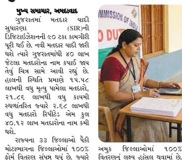
મુખ્ય સમાચાર, અમદાવાદ ગુજરાતમાં મતદાર યાદી સુધારણા (SIR)ની ડિજિટાઇઝેશનની ૯૦ ટકા કામગીરી પૂરી થઈ છે. નવી મતદાર યાદી જારી થશે ત્યારે ગુજરાતમાંથી ૪૦ લાખ જેટલા મતદારોના નામ કપાઈ જાય તેવું વિચારવામાં આવેલું છે.

મુખ્ય સમાચાર, અમદાવાદ દેશમાં નવરાત્રીથી જીએસટી દરોમાં ઘટાડો કરવામાં આવ્યો હતો તે પછી હવે નવેમ્બરમાં ટેક્સ આવકમાં ઘટાડો છે. ગુજરાત સરકારની નવેમ્બરની જીએસટી આવક ૬૭૨૩૨ કરોડ થઈ છે. ગત વર્ષમાં નવેમ્બર કરતા એક ટકો વધુ છે. જોકે, મહત્વની બાબત એ છે કે, નવેમ્બરમાં જીએસટી વિભાગે દરો ઓપરેશન માસ્ટર ૩૨.૪૦ કરોડની ટેક્સ ચોરી પકડી હતી. જીએસટીમાં ઘટાડો થયા છતાં ટેક્સ ચોરીના કારણોના ઘટ્યા ન હોવાની છાપ છે. નવેમ્બર-૨૦૨૫ સુધીના રાજ્યને જીએસટી હેકલ ડ્રા. ૨૭,૩૦૮ કરોડની આવક થયેલ છે જે ગત વર્ષના સમાન સમયગાળામાં થયેલ આવક ડ્રા. ૪૮,૦૮૮ કરોડ કરતા ૯% વધુ છે. નવેમ્બર-૨૦૨૫માં ગુજરાત