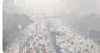
પછી, મુંબઈ હવે વલ્લા જતા શ્વસન સંકેતનો સામનો કરી રહ્યું છે. વાયુ પ્રદૂષણના કારણે લોકો ગુંચળાવાનું અનુભવી રહ્યા છે. મુંબઈમાં પરિસ્થિતિ એટલી હદે બગડી ગઈ છે કે શહેરના મોટાભાગના ભાગોમાં હવા ગુણવત્તા સૂચકકો ગંભીર સ્તરે પહોંચી ગયા છે. બપોલ-મુંબઈ મ્યુનિસિપલ કોર્પોરેશન એ શહેરમાં GRAP 4 લાગુ કર્યો છે. આ કારણે, એ તમામ બાંધકામ

મુખ્ય સમાચાર, મુંબઈ રાજધાની દિલ્હીમાં પ્રદૂષણની સમસ્યા વધેથી ધ્યાનમાં છે. જોડે મુંબઈ, બેંગલુરુ, કોલકાતા અને ચેન્નાઈ જેવા અન્ય મહાનગરોએ ધોરી રહેત અનુભવી છે. હવે, મુંબઈમાં પણ આ રહેતનો અંત આવી રહ્યો હોય તેવું લાગે છે. આર્થિક રાજધાનીમાં પ્રદૂષણના સત્રમાં વધારો અને પ્રદૂષિત હવાને કારણે પ્રતિબંધો લાદવામાં આવ્યા છે. પ્રદૂષણને નિયંત્રિત કરવા માટે મુંબઈમાં GRAP 4 પ્રતિબંધો લાગુ કરવામાં આવ્યા છે. આમ, મુંબઈ હવે પ્રદૂષણની દ્રષ્ટિએ દિલ્હીમાં જોડાઈ રહ્યા છે. મુંબઈના યાજ્ઞ વિસ્તારોમાં હવાની ગુણવત્તા નબળી અને ખૂબ જ નબળી શ્રેણીમાં આવી ગઈ છે. આ વિસ્તારોમાં મારગદાર, દેવનાર, મલાડ, ભોલોલી પુર્વ, ચકલા-અધેરી પુર્વ, નેવી નગર, પવઈ અને મુલ્કોનો પ્રતિવેશ થાય છે. મુંબઈ-દિલ્હી