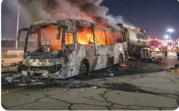
મુખ્ય સમાચાર, સિયાહ સોમવારે મોડી રાત્રે સાઉદી અરબમાં થયેલા રોડ અકસ્માતમાં ૪૨ ભારતીયોનાં મોત થયા હતા. મક્કાથી મદીના જઈ રહેલી બસ ડીઝલ ટેન્કર સાથે અથડાઈ હતી અને તેમાં ભીષણ આગ લાગી હતી. મૃતકોમાં ૨૦

મહિલાઓ અને ૧૧ બાળકોનો સમાવેશ થાય છે. આ અકસ્માતમાં માત્ર ડ્રાઇવર જ બચી ગયો હતો. મોટાભાગના મૃતકો હૈદરાબાદના હોવાનું કહેવાય છે. આ અકસ્માત મદીનાથી લગભગ ૧૬૦ કિલોમીટર દૂર મુહરર નજીક ભારતીય સમય