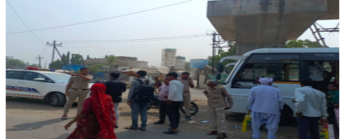
જામનગર શહેરમાં ટ્રાફિકને અડચણરૂપ થતા ૧૦૦ થી વધુ વાહનો ડીટેઈન કરાયા. જામનગર શહેરમાં ટ્રાફિક સમસ્યા સતત વધતી રહેતી હોય છે. ત્યારે ટ્રાફિક પોલીસ દ્વારા દિવાળીના તહેવાર નિમિત્તે ખાસ મેગા ડ્રાઈવ ચોજવામાં આવી રહી છે. શહેરમાં અલગ અલગ વિસ્તારમાં ટ્રાફિક શાખા દ્વારા કાર્યવાહી કરવામાં આવી છે. તેમજ શહેરમાં ટ્રાફિક સમસ્યા ન સર્જાય તે માટે શહેરના સાત રસ્તા સર્કલ, ખોડીયાર કોલોની, દિગ્જામ સર્કલ, સમર્પણ સર્કલ, એસ.ટી રોડ, જી.જી. હોસ્પિટલ રોડ, વિક્ટોરિયા પુલ, જેવા મહત્વના સ્થળો ઉપર જાહેર માર્ગો પર અડચણરૂપ ટ્રાફિક કરતા ગેરફાવટેસર પેસેન્જર ભરતા, અડચણરૂપ વાહનો ડ્રાઈવિંગ લાઈસન્સ વગરના વાહન ચાલકો વિરુદ્ધ ખાસ મેગા ડ્રાઈવ ની કામગીરી કરવામાં આવી હતી જેમાં રીક્ષા, ખાનગી ટ્રાવેલરની બસો, ઈકો તેમજ અન્ય પેસેન્જર વાહનો કુલ મળીને ૧૦૦ થી વધુ વાહનોને ડીટેઈન કરી ટ્રાફિકને અડચણરૂપ થનાર વાહનો સામે કડક કાર્યવાહી કરવામાં આવી હતી. જ્યારે આ કામગીરી જિલ્લા પોલીસ વડામણેમુખર ડેલુની સૂચનાથી તેમજ ઉચ્ચ ના સીધા માર્ગદર્શન હેઠળ ટ્રાફિક શાખાના પીઆઈ એમબી ગજ્જર ની આગેવાનીમાં કરવામાં આવી હતી. તેમાં કાર્યવાહી કરી ૧૦૦ થી વધુ વાહનો કિટેન કરી કાયદેસરની કાર્યવાહી કરવામાં આવી હતી.