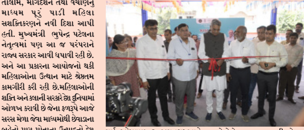
પાર્ક, ઓસવાળ-૩, જામનગર ખાતે દિવાળીની ખરીદી માટે અવનવી વસ્તુઓના મહાકુંચ એવા પ્રાદેશિક સરસ મેળાનું આયોજન કરેલ છે. જેમાં ગુજરાત રાજ્યના ૩૩ જિલ્લાના જુદા જુદા ગામના પાપ સ્વસહાય જૂથની બહેનો તેમજ જુદા કારીગરો દ્વારા વિવિધ કલાત્મક ચીજ વસ્તુઓના વેંચાણથી આજીવિકાની ઉત્તમ તક પૂરી પાડવાની સાથે ગ્રાહકોને પણ અવનવી વસ્તુઓ ખરીદવાનો લાભ આ મેળામાં મળી રહેશે.