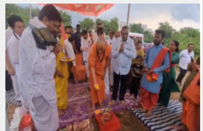
વ્યવસ્થાઓ ઊભી કરવામાં આવી છે તેમજ આ વ્યવસ્થાઓ દાતાઓ જોવે અને તેમના રૂપિયાનો સદઉપયોગ થઈ રહ્યો છે તે માટે ધર્મ સભાનું આયોજન કરવામાં આવ્યું હતું જેમાં દારિકા પીઠાધિશ્વર જગદગુરુ શંકરાચાર્ય શ્રી સદાનંદ સરસ્વતી જી મહારાજ ઉપસ્થિત રહ્યા હતા તેમજ તેઓના હસ્તે

મુખ્ય સમાચાર, મોરબી મોરબી પાંજરાપોળ ખાતે આજે દારિકા પીઠાધિશ્વર જગદગુરુ શંકરાચાર્ય શ્રી સદાનંદ સરસ્વતી જી મહારાજની વિશેષ ઉપસ્થિતિમાં ધર્મસભા નું આયોજન કરવામાં આવ્યું હતું તેમજ મોરબી પાંજરાપોળ ની જમીન માં નવા પ્રોજેક્ટ શરૂ કરવાના હોય જેનું ભૂમિ પૂજન પણ શંકરાચાર્ય ના હસ્તે કરવામાં આવ્યું હતું.