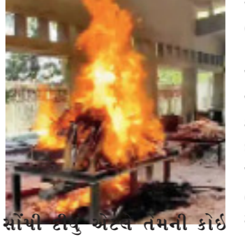
સૌથી ટાંચુ બંધ રહે તેમની કોઈ જવાબદારી જ ન હોય તેવો વ્યવહાર કરવામાં આવે છે. વાંબા સમયથી ઇલેક્ટ્રિક-ગેસ વિભાગ બંધ હોવાથી ઘણાઓને કલાકો સુધી રાહ જોવી પડે છે, કેટલાક ઘણાઓ તો ફોન કરી વહેલો ક્રમ આવે તે માટે ભલામણ કરતો ફોન કરે છે કે કમનસીબી છે. રામનાથપરા સ્મશાનગૃહના સંચાલક

રામનાથપરા સ્મશાનગૃહમાં બે ઇલેક્ટ્રિક અને એક ગેસ વિભાગ છે, જેમાંથી એક ઇલેક્ટ્રિક વિભાગ છ મહિનાથી અને ગેસ વિભાગ એક વર્ષથી બંધ છે. મોટામવામાં એક ઇલેક્ટ્રિક વિભાગ આવેલો છે તે આઠ મહિનાથી બંધ છે. મવડી અને બાપુનગરના ઇલેક્ટ્રિક સ્મશાનગૃહમાં વરસાદના પાણી ધૂસી ગયા હતા ત્યારથી તે બંને સ્થળે ઇલેક્ટ્રિક વિભાગ બંધ છે. રૈયામાં એક ઇલેક્ટ્રિક અને એક ગેસ વિભાગ છે જે બંને ચાલુ છે. આમ શહેરના અલગ અલગ પાંચ સ્મશાનમાં ૮ ઇલેક્ટ્રિક-ગેસની ચીમની આવેલી છે જેમાંથી ૫ બંધ છે. સ્મશાનગૃહના સંચાલકોએ વેદના ઠાવવતા કહ્યું હતું કે, મહાનગરપાલિકાએ તેમને સંચાલન