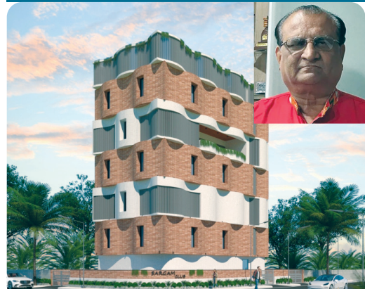
મુખ્ય સમાચાર, રાજકોટ શિક્ષણ સહિતના ક્ષેત્રમાં છેલ્લા ૪૩ વર્ષથી કાર્યરત સેવાભાવી સંસ્થા

૧૫ માર્ચથી સભ્ય નોંધણી ઝુંબેશ શરૂ થશે : નજીવી ફીમાં વર્ષ દરમિયાન મનગમતા કાર્યક્રમોની વણઝાર : ૧૦ કરોડના ખર્ચે સરગમ કલબનું પોતાનું સેવા ભવન બની રહ્યું છે, ડોનેશન માટે અપીલ