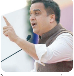
મુખ્ય સમાચાર, ગાંધીનગર રાજ્ય સરકાર દ્વારા લગ્નનોંધણી કાનુનમાં કરવામાં આવેલા ફેરફાર સંદર્ભમાં આજે માહિતી આપતા નાયબ મુખ્યમંત્રી શ્રી હર્ષ સંઘવીએ જણાવ્યું હતું કે લગ્ન એ ભારતમાં ૧૬ સંસ્કારોમાં મહત્વનું એક સંસ્કાર છે અને ભારતની પરંપરા જાળવવાના હેતુથી આ ફેરફાર કરવામાં આવ્યા છે. વિધાનસભામાં નવા લગ્નનોંધણી કાનુન અંગે પ્રસ્તાવ રજૂ કર્યા બાદ પત્રકારો સાથેની વાતચીતમાં શ્રી સંઘવીએ જણાવ્યું હતું કે સરકાર પ્રેમ લગ્ન વિરોધી નથી પરંતુ જેઓ છળ, કપટથી અને ભોળીભાળી દિકરીઓને ફસાવશે તો તેને છોડવામાં આવશે નહીં.

કે આ સમગ્ર નવા સુધારામાં લગ્ન કરનાર યુવક-યુવતીઓ અને માતા-પિતા બંનેનું હિત જાળવવાનું રહે તે જોવામાં આવ્યું છે. તેમણે ઉમેર્યું કે રાજ્ય માતા સીતાનું હરણ કરવા સાધુના વેશમાં આવ્યો હતો. પરંતુ આપણે તે થવા દેશું નહીં અને હું દિકરીના ભાઈ તરીકે ઉભો રહેવા માટે તૈયાર છું.