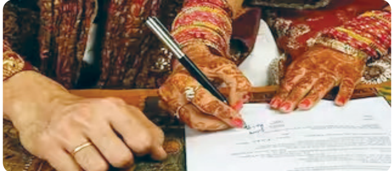
મુખ્ય સમાચાર, ગાંધીનગર ગુજરાતમાં હવે આગામી દિવસોમાં ભાગીને કે પરિવારની સંમતિ વગર લગ્ન કરવા અને તેની નોંધણી કરાવવી વધુ મુશ્કેલ બનશે. આજે વિધાનસભામાં રજૂ કરાયેલા

રાજ્યમાં લવ જેહાદ - ભાગેડુ લગ્ન સામે વિવિધ સમાજ દ્વારા કરાયેલી રજૂઆતનો પડવો પડવો : અરજી કરશો એ જ મીનીટે માતા-પિતાના વોટ્સઅપમાં માહિતી મળશે : લગ્નનોંધણી માટે વર - વધુએ રૂબરૂ હાજર થવું ફરજીયાત