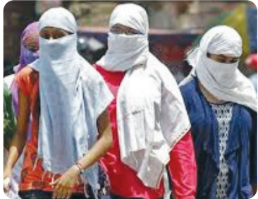
ડિગ્રી ઊંચું નોંધાઈ રહ્યું છે. રાજ્યમાં હાલમાં ઉત્તર-પશ્ચિમથી ઉત્તરીય પવનો ફૂંકાઈ રહ્યા છે. તાપમાનમાં વધારાનું મુખ્ય કારણ પૂર્વીય પવનો છે, જે પ્રમાણમાં ગરમ હોય છે. હાલમાં આપણે ઉનાળા તરફ આગળ વધી રહ્યા હોવાથી આ એક ટ્રાન્ઝિશન પિરિયડ છે. આગામી ૪ દિવસ પછી ન્યૂનતમ તાપમાનમાં ૨થી ૩ ડિગ્રીનો વધારો થઈ શકે છે, જેનાથી ગરમીનો અહેસાસ વધશે. સમગ્ર રાજ્યમાં આગામી ૭ દિવસ સુધી વાતાવરણ મુખ્યત્વે સુકું રહેશે. દરિયાકાંઠાના વિસ્તારોમાં પવનની ગતિ ૧૦થી ૧૫ નોંદસની અસરપાસ રહેશે. હાલમાં માછીમારો માટે દરિયો ન ખેડવા અંગેની કોઈ ચેતવણી જાહેર કરવામાં આવી નથી.

મુખ્ય સમાચાર, રાજકોટ રાજ્યમાં હાલ ઠંડી વટી છે અને દિવસે ગરમીનો અહેસાસ શરૂ થયો છે. આગામી ૪ દિવસ તાપમાનમાં કોઈ ખાસ ફેરફાર નહીં થાય, પરંતુ ત્યારબાદ ૨-૩ ડિગ્રી તાપમાન વધશે. હવામાન વિભાગના જણાવ્યા અનુસાર, આગામી દિવસોમાં દક્ષિણ ગુજરાતના અમુક વિસ્તારોમાં તાપમાનમાં ૨થી ૩ ડિગ્રીનો ઘટાડો નોંધાયો છે, જ્યારે બાકીના વિસ્તારમાં કોઈ ખાસ મોટો ફેરફાર જોવા મળ્યો નથી. રાજ્યમાં સૌથી ઓછું તાપમાન નિલવામાં ૧૧ ડિગ્રી સેલ્સિયસ અને અમદાવાદમાં ૧૬ ડિગ્રી સેલ્સિયસ નોંધાયું છે. હાલમાં મહત્તમ તાપમાન સામાન્ય કરતા ૩થી ૪