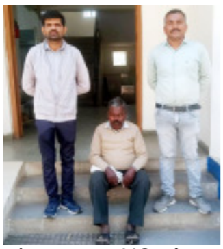
હતી. આ દરમિયાન HC જણાવ્યા પછી વધેલા અને ડી જિજ્ઞેશાભાઈ કાસુબ્રાને પાનગીરાલે માહિતી મળી કે, મોરબી

મુખ્ય સમાચાર, મોરબી મોરબી તાલુકા પોલીસ સ્ટેશનમાં લુંટ અને ઘાડના જુદા-જુદા બે ગુનાઓમાં છેલ્લા ૨૯ વર્ષથી નાસતા ફરતા મુખ્ય મધ્યપ્રદેશના વતની આરોપીને મોરબી એલ.સી.બી. અને પેરોલ ફ્લો રફવોડ ટીમ પાનગીરાલે મળેલ પાતમીને આધારે મોરબીની રવિરાજ ચોકડી ખાતેથી અટક કરી આગળની કાર્યવાહી માટે મોરબી તાલુકા પોલીસ સ્ટેશનને સોંપવામાં આવ્યો છે.